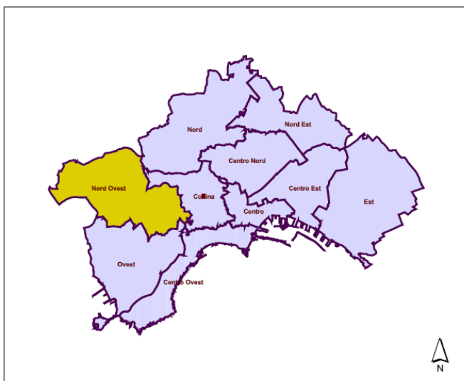
Municipalità Nord Ovest (9) – Soccavo Pianura